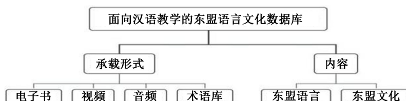
Figure 1. Three level framework of database

其中，第一层级以“面向汉语教学的东盟语言文化数据库”为总层级，下分“承载形式”和“内容”两个模块为第二层级，将东盟语言文化数据库以两种检索方式呈现出来。使用者检索打开“承载形式”后，可以直观看到由“承载形式”分类出四个第三层级，即：电子书、视频、音频、术语库；而检索打开“内容”则出现另外两个第三层级，即：东盟语言、东盟文化。如图1所示：