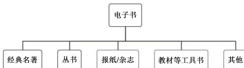
Figure 2. The fourth level framework of database (e-Book)

第四层级由众多的下属概念组成。如检索打开“电子书”，有包括“经典名著”、“丛书”、“报纸杂志”、“教材等工具书”、“其他”在内的五种电子书内容，以供使用者遴选出适合自己的阅读方式。如图2所示：