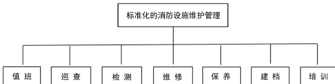
Figure 2. Standardized maintenance and management of fire fighting facilities

持有初级技能以上等级职业资格证书；三是值班期间，值班人员应每 2 小时在《消防控制室值班记录表》上记录一次消防控制室内消防设备的运行情况，及时记录火警或故障情况。