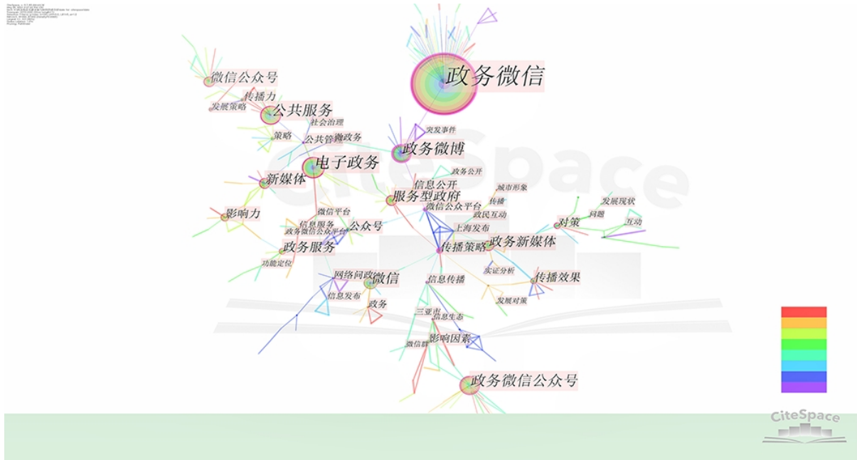
Figure 3. Keyword visualization analysis graph 图 3. 关键词可视化分析图