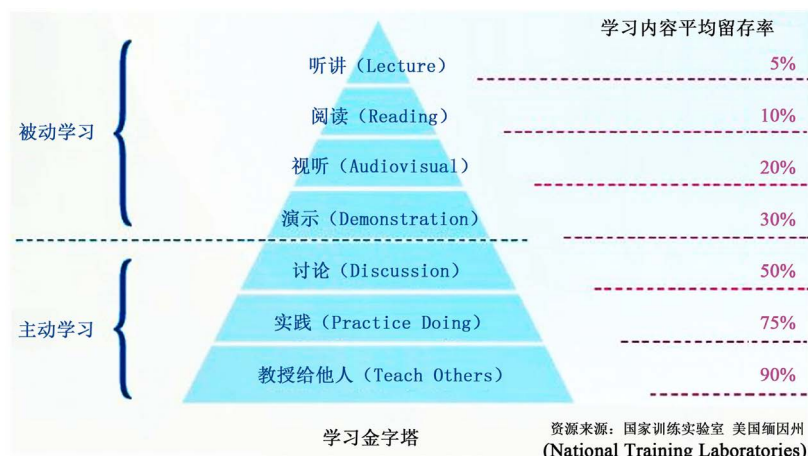
Figure 2. Cone of learning 图 2. 学习金字塔

动手去做,学习效果增加。这样使他们每做一项护理操作都有支持工具,而且,事前可反复熟读和演练,减少出错的几率。微信-流程化教学法使带教老师的教学目标更明确,教学思路更清晰。传统带教时,老师在工作中遇到什么讲什么,缺乏严谨的语言组织和知识逻辑链接过程,学生们只是被动地听,囫圇吞枣地接受,甚至连护理术语、药名和器械名称分不清记不住,操作时容易出错或反复翻工。微信-工作流程化教学方法可以在学生离开手术室后,通过微信的图片、文字、音频视频进行复习,加深记忆,还可以在群中发起讨论、师生互助、咨询查询等互动活动。另外,除微信外还有许多其他的取之不尽,用之不竭的网络资源,如百度知识库、丁香园等。