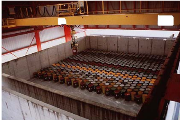
Figure 2. Schematic diagram of Aube disposal sites 图 2. 奥布处置场处置单元

免雨水进入。废物被处置在大型混凝土处置单元内，所有操作都是在金属隔框的保护下进行，防止废物包和雨水发生接触。该设施的设计可以顺利适应可能产生的不同类型的废物包，不论是传统尺寸的废物桶(200 L)还是更大的包装(核电站的反应堆顶盖) [3]。