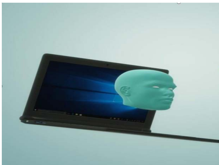
Figure 3. An example of a student's multimodal output (No. 2)