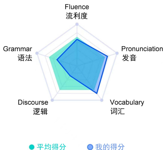
Figure 2. Skill score 图 2. 技能点得分