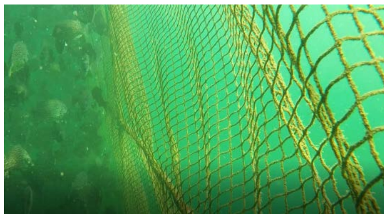
Figure 2. Net of with spotted Knifefjaw in off-shore sea cage (Treat group) 图 2. 投放斑石鲷处理组的网衣