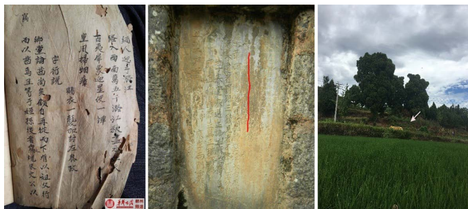
Figure 2. Li Sicong's mission-to-Myanmar poem preserved in Xiaotang village (Left), ancient well stele and the text (Middle), and Li Sicong's cemetery (Right, arrowed) 图 2. 筱塘村保存的李思聰《過怒江百夷叻孟傳典等來迎》詩(实物, 左)、古井碑文(中)以及李思聰墓地(右)