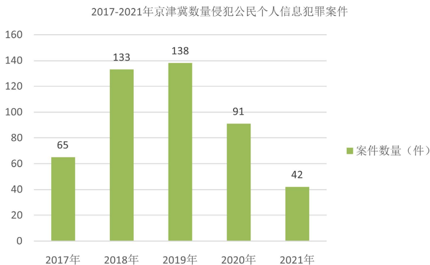
Figure 1. Distribution of crimes against citizens' personal information in Beijing, Tianjin and Hebei from 2017 to 2021

民个人信息犯罪共计发生 469 例 1 , 可见该区域个人信息犯罪情况较为严重, 亟需对此类犯罪加以规制。从时间维度来看, 2017 年、2018 年、2019 年、2020 年、2021 年侵犯公民个人信息罪对案件分别有 65 例、133 例、138 例、91 例、42 例(见图 1)。由以上数据可明显看出, 2020、2021 年侵犯公民个人信息类案件数量总体呈下降趋势, 这可能是受到新冠疫情的影响, 大部分案件都推迟审理, 使得 2020、2021 年度涉侵犯公民个人信息罪的案件有所减少。但就整体数据而言, 可以推断出侵犯公民个人信息犯罪呈现逐渐递增的趋势。由此可见, 当前京津冀区域侵犯公民个人信息犯罪形势较为严峻, 三地有关部门应重视对此类犯罪的打击与预防。