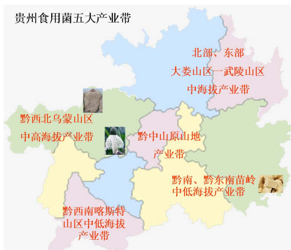
Figure 1. Five industrial belts of edible fungi in Guizhou

节。近年来贵州食用菌生产发展迅速,根据贵州省发展食用菌产业助推脱贫攻坚三年行动方案(2017~2019年)文件,3年内贵州省食用菌种植规模可达40万亩(40亿棒),产量达240万吨,产值达300亿元,累计带动50万建档立卡贫困人口脱贫。