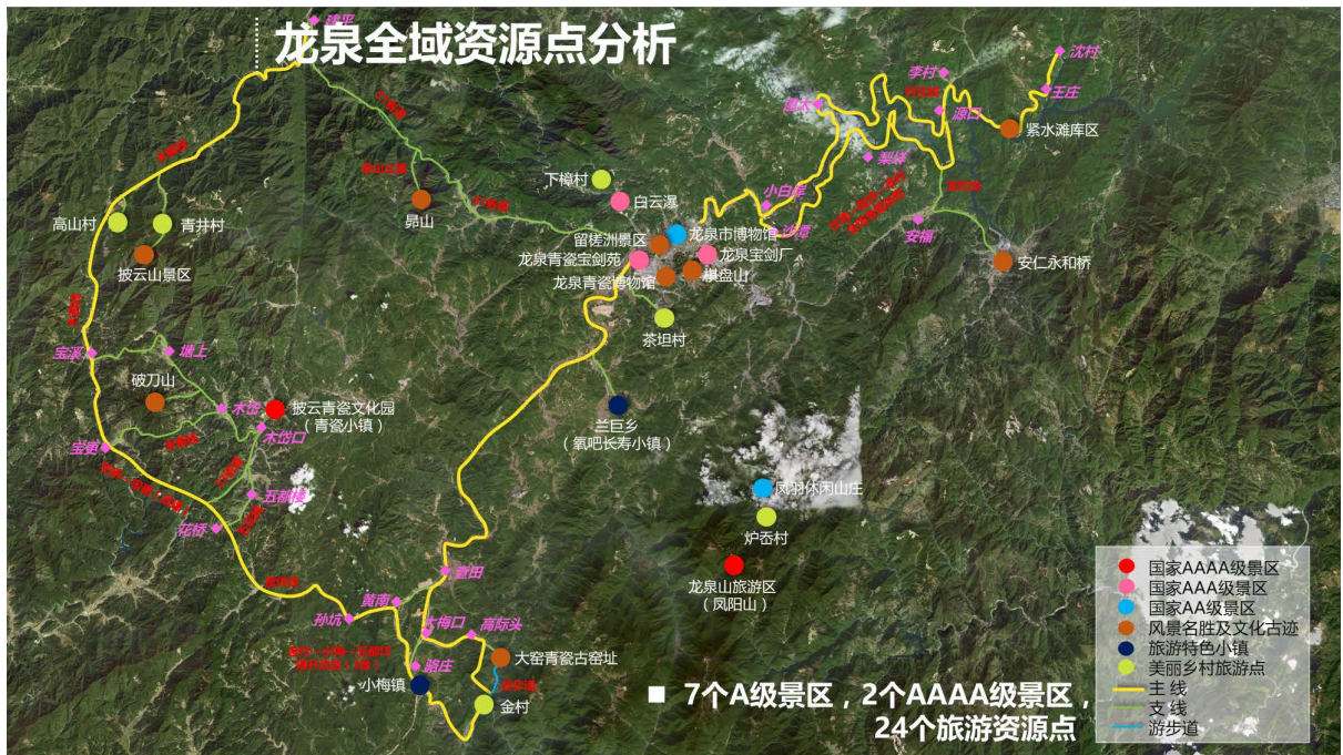
Figure 3. Longquan beautiful economic traffic corridor layout 图 3. 龙泉美丽经济交通走廊布局图

法, 具有重要的实用价值, 从而为区域交通走廊的建设提供依据。为综合交通系统规划和城市布局结构的调整提供依据。