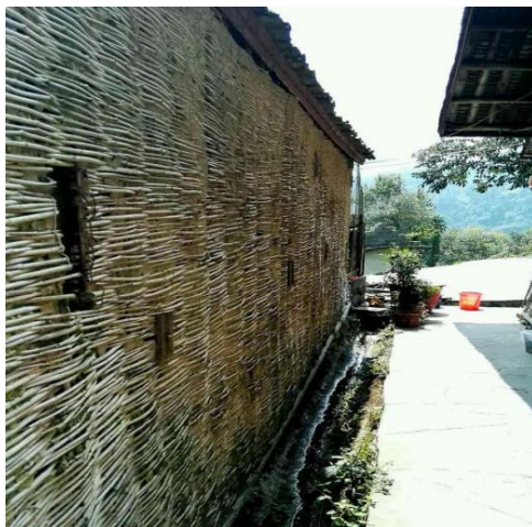
Figure 2. Bamboo house