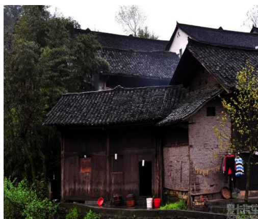
Figure 3. Wooden House