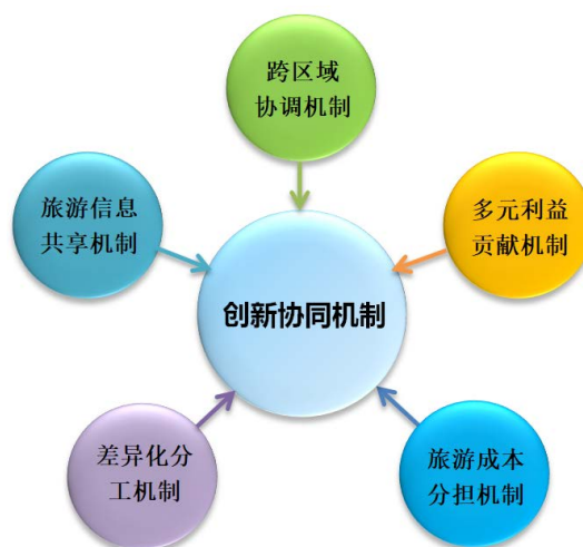
Figure 3. Innovation and coordination mechanism 图 3. 创新协同机制

东北与京津冀旅游产业协同还应充分利用“互联网+”数字平台，构建旅游信息共享机制。目前京津冀以及东北各省已经建立自己的大数据网络平台，均涵盖旅游产业，包括旅游目的地信息，入境旅游者数量、消费偏好、各项消费实时数据等内容。首先黑龙江省与京津冀在旅游大数据、整体营销、区域间企业合作等方面实现互融互通，才能确保黑龙江省与京津冀协同的步调一致，减少盲目性，提高对接的有效性。其次我们要建立区域旅游信息中心。该中心的核心职能就是根据大数据统一调控旅游信息，如旅游目的地营销、旅游淡旺季的游客分流、旅游服务人员信息等，有效配置区域旅游资源，实现智慧旅游信息无缝合作。第三我们可以借鉴“长三角”无障碍旅游区的网络化发展模式，打造东北与京津冀旅游一体化战略，创新性建立网上旅游超市，搭建旅游交易平台，从政府招标、企业推广、产品定制、客户个性化需求发布等实现多元化无障碍对接。最后我们还要充分适应当下消费者的习惯，依托国内优质在线旅游企业平台开发打造属于我们自己的专属 APP，使得旅游者可以在任何时间、任何地点都可以查询到东北与京津冀旅游的相关活动信息，构建网络集散中心，为旅游者出行和旅游提供便利。