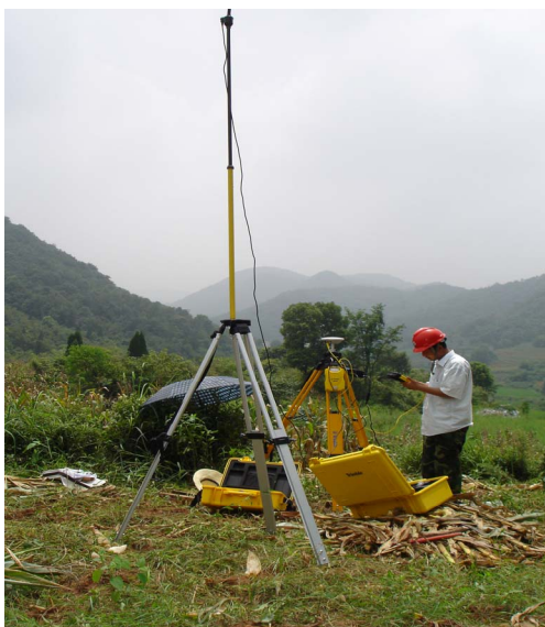
Figure 2. The erection of base station 图 2. 架设基站

6) 对导航的 12#杆塔中心桩点位,若有设计桩与 11#~15#两点间的测量基线校核误差;若无设计桩,定位补桩。补桩后,需校核误差,无误后,键入此点数据,作为定位点 12#塔位中心桩坐标。