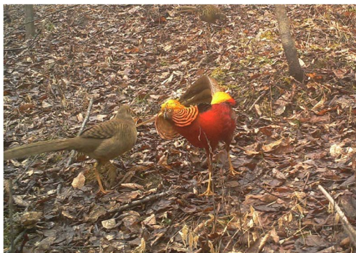
Figure 5. Chrysolophus pictus 图 5. 红腹锦鸡