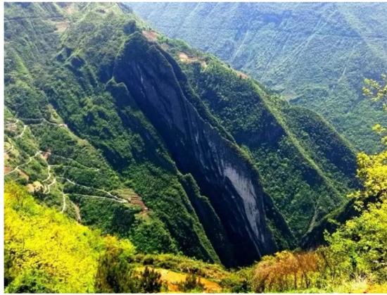
Figure 1. Chongqing Yintiaoling national nature reserve 图 1. 重庆阴条岭国家级自然保护区