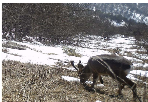
Figure 6. Capreolus pygargus 图 6. 狍

该国家级自然保护区目前作为一个国家和地区重点保护的野生动物保护种类数量相对较多, 主要集中在广泛分布于野生保护区的鸟类和兽类中, 调查结果综合分析显示, 保护区共有国家重点保护野生动物(国 I、II) 7 目 13 科 36 种, 占保护区野生脊椎动物物种总数的 11.3%; 分布于中国的特有种有 23 种, 占野生脊椎动物物种总数的 72% [10]。根据相关的国家名录划分了该地区保护动物的具体保护级别及数量状况详见表 3、表 4: