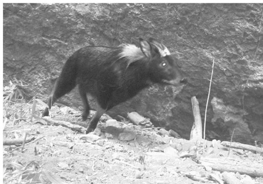
Figure 3. Capricornis sumatraensis

保护区内共发现有鸟类 208 种,兽类 55 种[9],包含了国家重点保护物种,易危物种如鬣羚、小鹿(图 3、图 4)及近危物种如红腹锦鸡、豹(图 5、图 6),整个保护区呈现出生境类型多样化、兽类物种多样化的趋势。