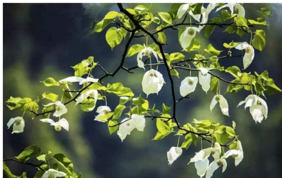
Figure 2. Davidia involucrata 图 2. 珙桐

保护区内目前发现有珍稀野生被子植物种类共计 53 种。其中作为国家 I 级自然重点保护物种野生植物主要有: 中国品种大叶红豆杉、珙桐(图 2)、南方大叶红豆杉、银杏; 部分树种列入国家名录 II 级列为国家地区重点保护的野生植物主要品种有眉山水青树、中华松和猕猴桃、光叶珙桐等三十余种; 此外园内还有眉山杜仲、秦岭冷杉等诸多国家级地区重点保护的珍稀野生植物及麦吊云杉、紫茎、白山树等十多种国家级重点保护珍稀物种和濒危野生植物。