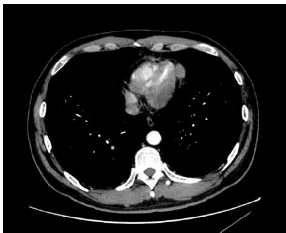
Figure 1. Preoperative CT

患者男 60 岁。1 月前 X 线胸部正位片发现胸腔内占位病变，复查超声提示可能为“心包囊肿”，收入心血管外科。患者术前体格检查未见异常，血压 116/73 毫米汞柱，心率 80 次/分钟，血氧饱和度 99%。计算机断层扫描提示心尖部占位病变，且与心包界限不清(图 1)。根据术前影像学检查结果怀疑“心包囊肿”。其他常规检查、检验均无异常。