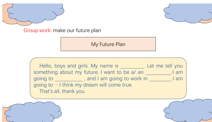
Figure 4. Group cooperation topics designed by teachers

T: If you do that, policeman will catch you!