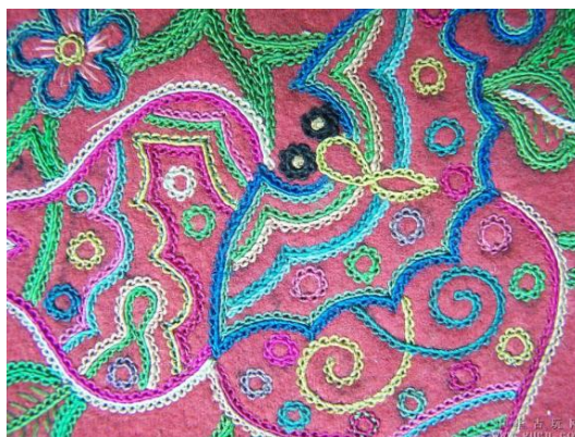
Figure 1. Lock embroidery

战国时期的苏绣色彩艳丽,文案丰富,图像大胆且具有丰富的想象力。在出土的刺绣针法是锁绣针法(见图1),也是中国出现最早的针法。绣品的图案主要是龙凤等祥瑞图案,同时使用藤蔓加以点缀装饰,色彩活泼艳丽,与楚国文化十分契合[1]。