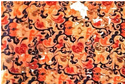
Figure 2. Xinqi embroidery 图 2. 信期绣 ②

汉朝出土的绣品类型多样, 其中主要有信期绣(见图 2)、长寿绣以及乘云绣[2]。信期绣通常以带穗的流云图案为主要表现方式, 描绘的是南北迁徙时的候鸟以及燕子; 长寿绣主要使用锁绣针法来描绘鸟头、云纹、花以及叶片等图案, 有长寿之义, 使用的丝线颜色靓丽; 乘云绣主要描绘祥云以及枝叶图案。针法上除了战国时期已经出现的锁绣针法, 还出现了铺绒绣。铺绒绣作为平绣的一种, 以纱为底以, 用直针平铺绣满, 针法整齐。是刺绣针法上的一大突破[3]。