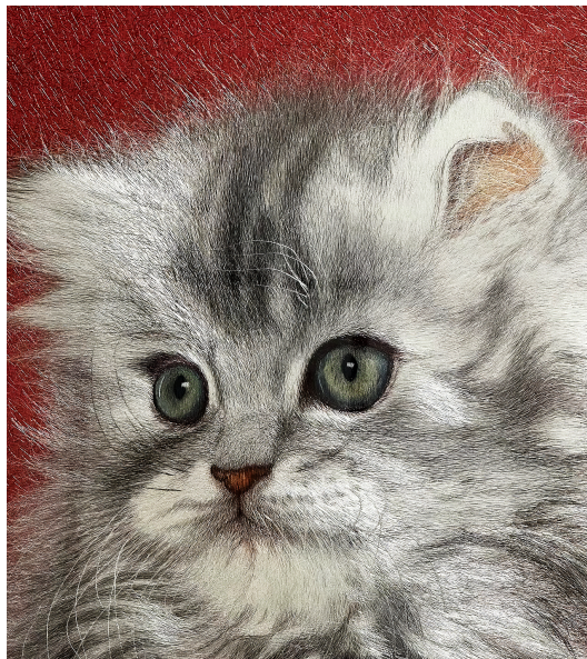
Figure 5. Creative Suzhou embroidery 图 5. 创意苏绣®