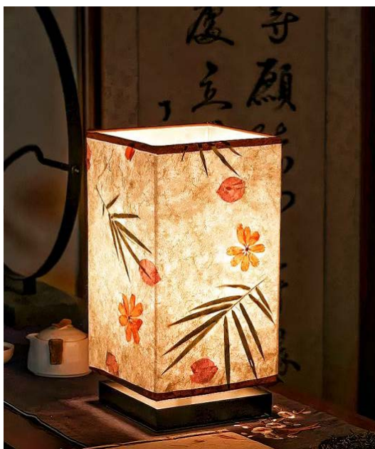
Figure 7. Suzhou embroidery creative retro table lamp 图 7. 苏绣创意复古台灯 ®

软装设计主要指对于家居陈设品的设计(见图 7), 包括形式、配色、材料等。运用各种手法呈现出一个极具审美意味的空间。苏绣与软装设计相结合, 一方面能够使软装更具韵味, 以方便也可以促进苏绣的进一步发展, 提高商业价值。