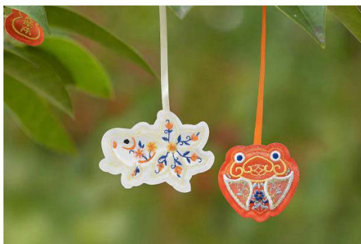
Figure 6. Suzhou Museum Suzhou embroidery bookmark 图 6. 苏州博物馆苏绣书签 ®