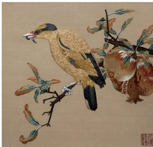
Figure 3. Gu Xiu 图3. 顾绣®

饰使用不同的题材比如龙、凤以及祥云、水纹等等。顾绣(见图3)是闺阁绣最有代表性的一脉，也是苏绣中极具代表性的分支。题材多为山水诗画，技法多样，丝线颜色过渡自然、衔接顺畅。很多绣品都将刺绣和绘画结合起来，这也与当时的文人阶级有着很大的联系。民间绣的发展与明朝的商业贸易密切相关，明朝繁荣的商业促使苏绣也拥有了广泛的市场。此时的苏州城几乎家家户户从事刺绣相关的工作。而昆曲的兴起也促进了苏绣的发展。