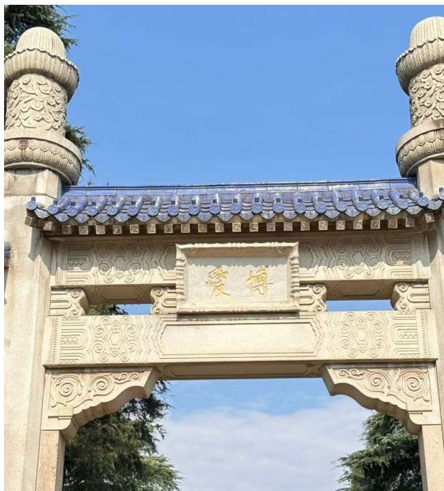
Figure 3. Pokoi square-self-photography

博爱坊(见图3)至祭堂之间有392级石阶，分为8个平台，高差73米，寓意当时我国3亿9千2百万人民。石阶连接牌坊、陵门、碑亭、祭堂，形成“警钟形”建筑。设计者将石阶分为10段，创新且具特色。攀登至第七层平台后，再上30、42、54级石阶至第八、九、十层平台，这段坡度陡峭，更显祭祀陵墓的宏伟。126级石阶两侧有石栏杆环绕，纵向设计两行栏杆将石阶分为三道。纪念堂建于第十层台基上，需经九级石阶进入祭堂。至此，中山陵共计10层平台、392级石阶。