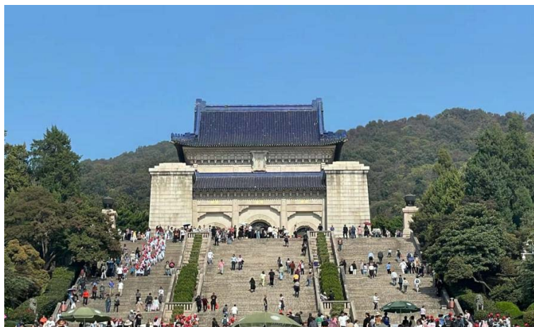
Figure 2. Memorial hall of Sun Yat-sen Mausoleum-self-photography 图2. 中山陵祭堂 ®

祭堂(见图2)是中山陵建筑群的主体部分，其功能为纪念和颂扬总理的丰功伟绩。建筑设计师巧妙地将中西建筑风格相结合，使祭堂呈现出庄严肃穆的氛围。堂内设有总理先生的铜像，四周墙壁上刻有总理先生的遗嘱和革命事迹，供后人瞻仰。