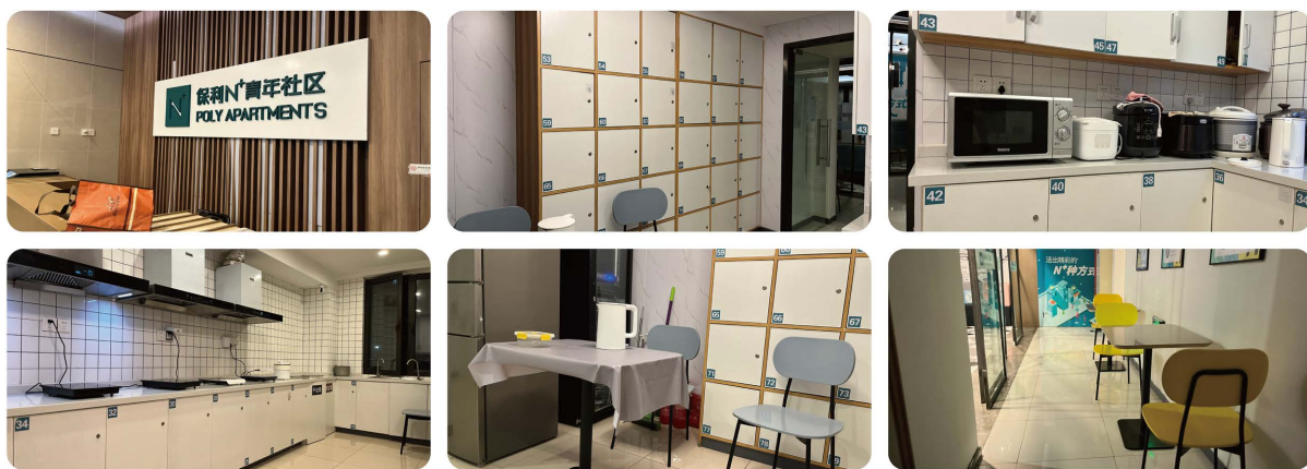
Figure 1. Poly youth community public kitchen

保利青年社区隶属于保利公寓,位于上海市宝山区上海大学附近。其内部布局空间合理,公共设施齐全,如图1。社区采用“居住-管理”模式,即由管理人员负责公共设施的租借、清洁和维保,而租户则需遵守公约并自觉保持卫生。此外,该社区会围绕公共厨房等空间举办各类活动,并欢迎外部年轻人参与,致力于打造一个区域内的青年文化中心。