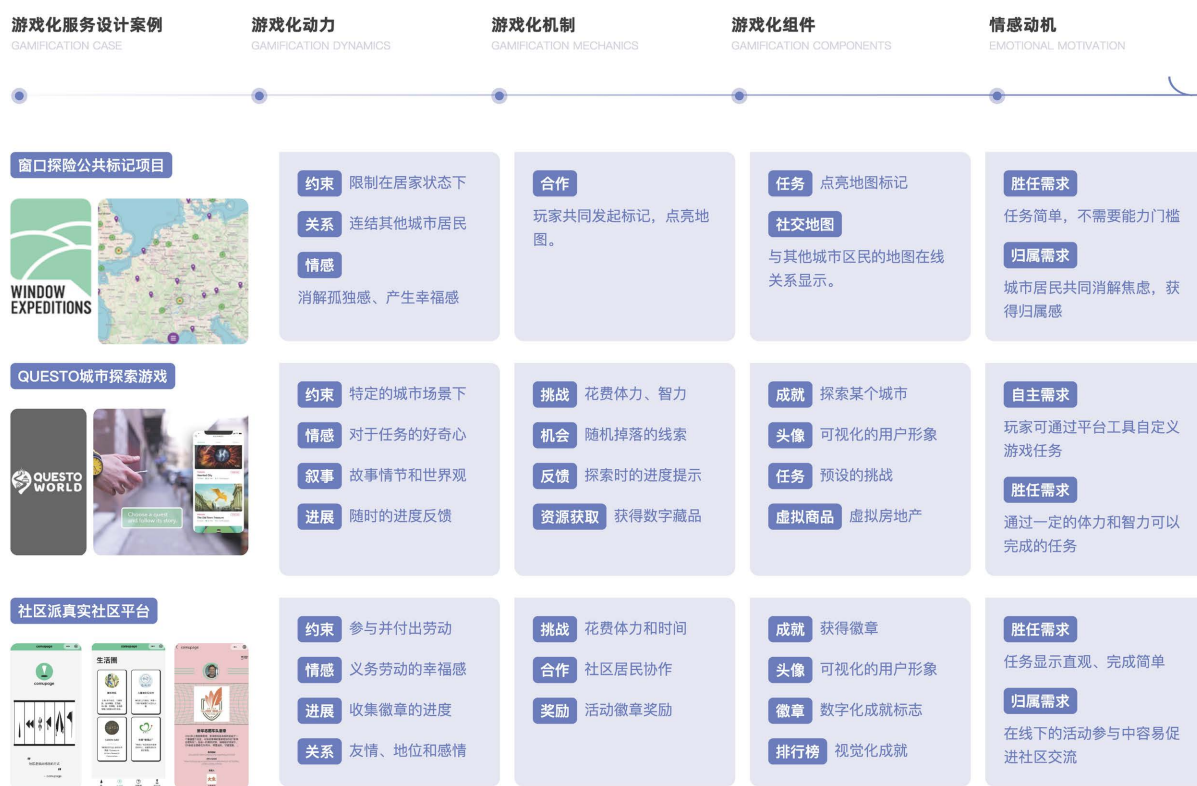
Figure 3. Analysis of gamification elements for service design cases

通过对三个游戏化服务设计案例的游戏化元素分析，总结游戏化服务设计的应用存在以下特点，如图 3。