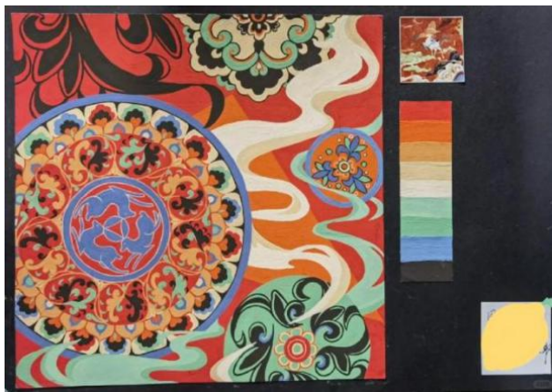
Figure 11. Dunhuang honeysuckle pattern color 图 11. 敦煌忍冬纹色彩 ®

敦煌忍冬纹的色彩丰富多样，包括红、黄、绿、蓝、紫等多种颜色。这些颜色在忍冬纹中相互交织、相互映衬，形成了绚丽多彩的艺术效果。敦煌忍冬纹色彩多样性的原因之一是文化背景。在佛教艺术中，忍冬纹的色彩被赋予了深刻的宗教意义。金色和银色作为高贵的颜色，代表着神圣和崇高；而红色和绿色等颜色则代表着生命和活力。这些颜色的运用不仅丰富了忍冬纹的视觉效果，也深刻地反映了佛教文化的内涵和精神寓意。在中国古代，色彩被赋予了丰富的象征意义和情感表达。不同颜色的运用，反映了当时人们对于自然、社会和生活的理解和感受[19]。敦煌忍冬纹色彩多样性的原因之二是艺术审美。古代艺术家们通过运用丰富的色彩和对比色，营造出绚丽多彩的艺术效果，展现了他们对美的追求和创造能力(图 11)。