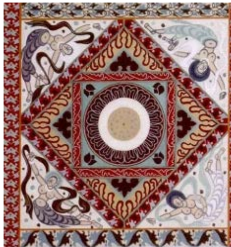
Figure 10. Four-piece honeysuckle pattern in Cave 272 A of the Northern Wei Dynasty