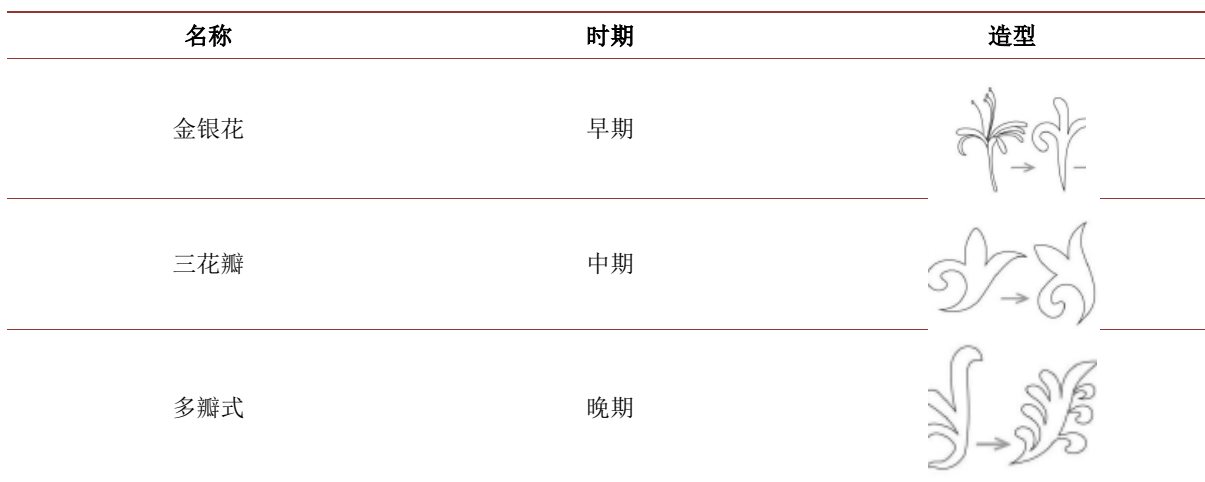
表 1. 忍冬草到忍冬纹样的演变图 ②