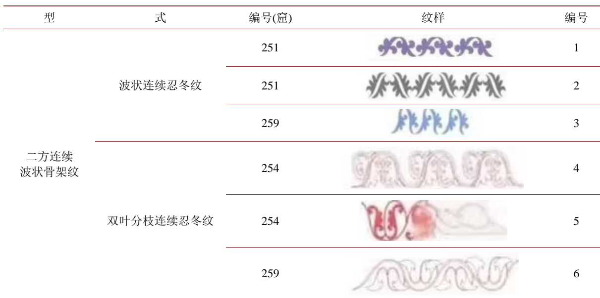
表 2. 敦煌连续组合忍冬纹纹样 ③

例如莫高窟 285 窟(图 2)是北朝唯一有确切纪念的石窟，它是其他同时期石窟中的佼佼者，无论是从石窟的大小，还是装饰纹样的种类，它都可以称作：敦煌艺术代表之作。285 窟分为前后两个部分，整体时正方四壁皆装饰着大量图案，西壁有多个龕，大佛在中央，两侧坐禅定比丘，龕间内容丰富：主要画印度诸神佛像，在佛像后的龕楣装饰大量装饰纹样如：毗瑟紐天、毗那夜迦、鸠摩罗天、帝释天及梵天摩醯首罗天等印度诸神。南壁之下有四间禅室。北壁中部通壁绘七铺说法图，画面给人一种独特性和复杂性的感觉。南壁画以五组故事画和一幅释迦多宝并坐说法图组成。窟顶四壁绘制有大量中国神话中的神人形象，在人物形象周边，装饰大量植物纹样，忍冬纹样也在其中。在其龕楣的装饰着一排忍冬纹样，此忍冬纹样就是共线的造型，相辅相成的关系，不仅是一种制约，而是一种相互依存，第一个忍冬纹样的尾部是第二个忍冬纹样的头部，循环展开，形成了共线造型忍冬纹样的组织形式，这也算是连续纹样中的一种，主要看内部忍冬纹样的变化。