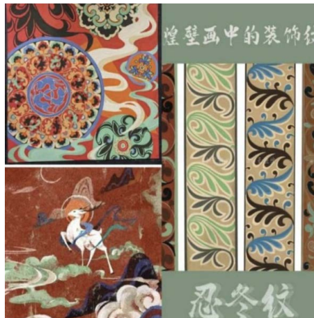
Figure 12. The color decoration of Dunhuang honeysuckle pattern