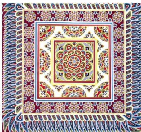
Figure 13. The caisson pattern of the Northern Zhou Dynasty in Dunhuang Cave 314

还有敦煌壁画的平棋图案(图 14),用冷色调来表现清澈流动的水池,这样不仅强化了图案主体,突出方井图案并成为视觉中心,又通过与忍冬纹样背景下的土红色这一暖色形成明显的冷暖对比,使得图案在色彩体现上更加整体,具有立体性。