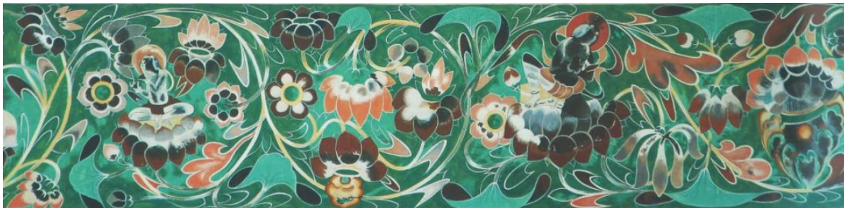
Figure 8. Honey-suckle pattern on top of herringbone shawl in Cave 427, Sui Dynasty

隋代第 427 窟人字披顶部(图 8)，画家不厌其烦地绘出一道精致的图案：在深绿的底色上，以缠枝莲茎和忍冬纹，按波浪形延续，构成一个个环形空间，其中画出盛开的莲花以及坐在莲花上的化生童子。这些化生童子显然象征着往生极乐净土的途径，他们坐在莲花上，有的怀抱琵琶，有的吹奏竖笛，一副无忧无虑、愉快欢歌的神态[14]。忍冬纹所占面积大，刻画细腻，笔致饱满，用线的婉转起伏表现出忍冬纹造型的灵动变化、空间的前后位置；色彩渲染方面，采用叠晕法，石青、石绿、深褐等色用不同明度的层次晕染，色彩更显丰富细腻，加强了忍冬纹的优雅灵动，彰显出自汉代以来我国古代绘画追求气韵生动的气质精神，形成了鲜明的民族特色。