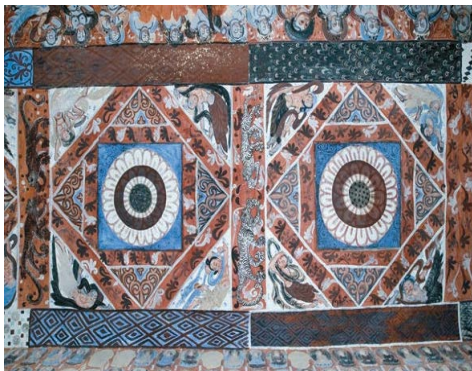
Figure 14. The flat chess pattern in Dunhuang murals