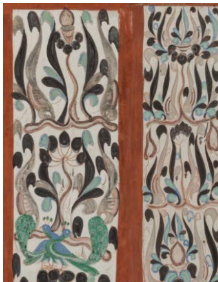
Figure 6. Cave 428 of the Northern Zhou Dynasty in Dunhuang 图 6. 敦煌北周第 428 窟 ⑧

由此可见, 美的韵律有一条绝对的原则, 就是整体的气势、气韵连贯性, 凡是美的东西绝不会中断得支离破碎, 彼此孤立毫无关系, 或让人感到不平衡不舒服。就如好的书法一样不是笔法的拼凑, 而是一气呵成。而内在的连贯性, 就是节奏的气势。忍冬纹的线条流转自如, 回环往复, 富有节奏感。其图