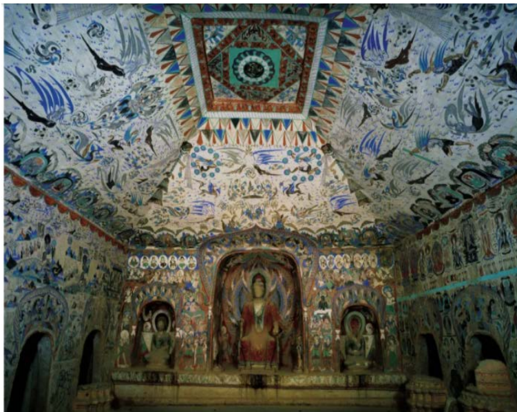
Figure 2. Mogao grottoes cave 285 图 2. 莫高窟 285 窟④

综上所述，敦煌忍冬纹形式美不乏变化与统一的特点，这使得忍冬纹既有丰富的变化，避免了单调和刻板，又保持了整体的协调和美感。这种形式美的展现，不仅符合人们的审美习惯，也传递了中国传统文化的深刻内涵。