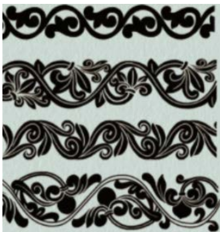
Figure 7. Wavy honeysuckle pattern

波状忍冬纹连续纹的线条呈现出一种起伏变化的特点，如同波浪一样有规律地波动。这种起伏变化使得纹样更加生动，给人以动态的美感。且该纹样线条在连续排列时，连贯性强，没有断点或连接点，给人以流畅且不乏一种动态的视觉之感，这很好地展现出敦煌忍冬纹流畅的艺术美感(图 7)。