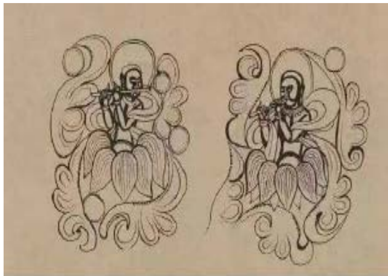
Figure 4. Part of Emei in Cave 249 of the Western Wei Dynasty 图 4. 西魏-249 窟峨眉局部：莲花伎乐化生 ⑥

敦煌忍冬纹的形式美是对称与均衡的完美结合，这种艺术手法不仅展现了古代艺术家们卓越的审美情趣和工艺技巧，也为我们提供了一个领略古代中国艺术之美的独特视角。通过对称与均衡的深入探讨，我们可以更深刻地理解忍冬纹的艺术价值，感受中华文明的博大精深[8]。