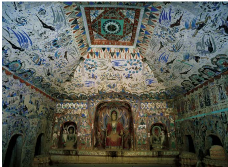
Figure 5. Cave 285 of the Western Wei Dynasty in Mogao Grottoes 图 5. 莫高窟西魏第 285 窟 ⑦

莫高窟北周第 428 窟(图 6)前坡莲荷忍冬摩尼宝珠禽鸟纹人字披, 图案结构为四层忍冬枝, 忍冬枝中也为莲花, 莲花左右两侧各连接 H 叶多瓣式卷曲的忍冬叶, 排列的朝向、疏密规律一致。有的把摩尼宝珠、飞天、鹿的形象也组合在图案中, 周围又长出新的忍冬叶, 整个图案丰富连贯, 一气呵成, 花叶向上的灵动韵律, 摇摆荡藻, 婀娜多姿。纹样勾线流畅, 色调黄、土红为主, 石青、石绿交错设色, 使得忍冬纹样产生一种活跃的节奏韵律。