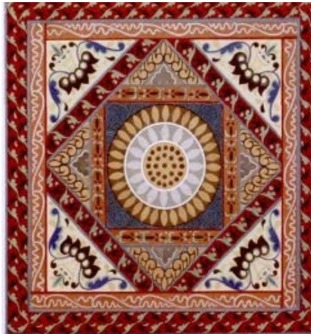
Figure 9. H-petal honeysuckle pattern in Cave 249 of the Northern Wei Dynasty

敦煌北凉第 272 窟藻井(图 10), 四周的边饰中有一组为两片忍冬叶相背为单位首尾相连反复连续, 另一组 A 四片忍冬叶对角线排列构成一个单元再进行反复排列, 红为底, 忍冬叶石绿单色平涂, 通过这种在一个骨架中纹样呈单元反复重复出现, 形成一种反复与条理敦煌壁画中忍冬纹条理与反复之美主要体现在边饰中, 有单叶忍冬纹一正一反首位相连呈波状二方连续反复排列; 有两片忍冬叶相背为一单位首尾相连作波状二方连续反复排列; 也有单片忍冬叶直立由中屯、向左右渐变排列, 产生规律的反复条理之美。二方连续排列忍冬纹样在敦煌壁画中类型多种多样[17]。