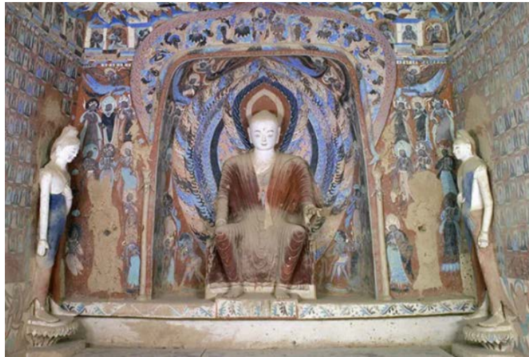
Figure 3. Western Wei Dynasty-Cave 249 of Mogao Grottoes 图 3. 西魏 - 莫高窟 249 窟 ⑤