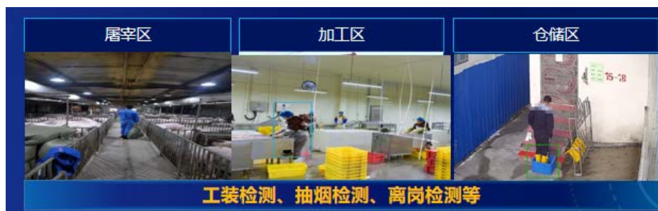
Figure 4. Control chart for key process positions in the slaughtering industry 图 4. 屠宰行业关键工序岗位管控图

在屠宰区、加工区、仓储区的关键工序安装电子摄像头,加强工装检测、抽烟检测、离岗检测等,见图 4。