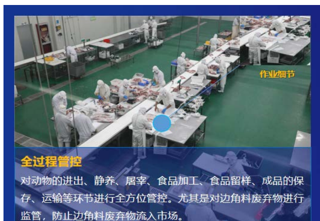
Figure 5. Detailed control diagram for slaughterhouse operations 图 5. 屠宰场作业细节管控图

对动物的进出、静养、屠宰、食品加工、食品留样、成品的保存、运输等环节进行全方位管控,尤其是对边角料废弃物进行监管,防止边角料废弃物流入市场。在屠宰场作业细节处安装电子摄像头,对屠宰场全过程管控,见图 5 屠宰场作业细节管控图。