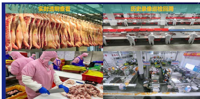
Figure 6. Historical video inspection retrospective map 图6. 历史录像巡检回溯图

有关屠宰企业要在对生猪进厂查验、宰前停食静养、生猪屠宰、同步检疫检验、无害化处理、分割包装和肉品出厂等重点环节，实时监控和录播存储(存储期为2年)，这样，可以进行实时透明查看，历史录像巡检回溯。为肉类食品质量安全提供追溯依据，见图6。历史录像巡检回溯图。