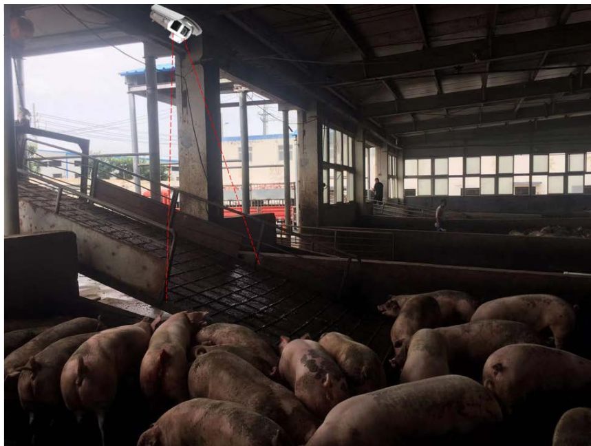
Figure 2. Installation diagram of equipment at the entrance of the pig farm 图 2. 猪场入口处设备安装示意图