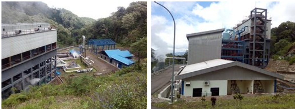
Figure 2. Cloth wellhead geothermal power station in Wulong 图 2. 武隆布井口地热电站